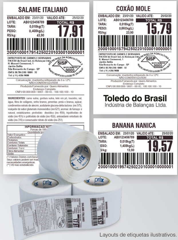
Layouts de etiquetas ilustrativos.

Essa solução resulta em economia, versatilidade e padronização no estabelecimento comercial. Além de conferir maior comodidade ao varejista que terá somente um único modelo de etiqueta para todas as balanças, departamentos e lojas, resultando em ganhos de produtividade e eliminando praticamente todo o tempo gasto com as trocas de etiquetas.