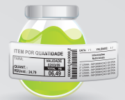
Exemplo de aplicação

*Percentual de valores diários fornecidos pela porção.