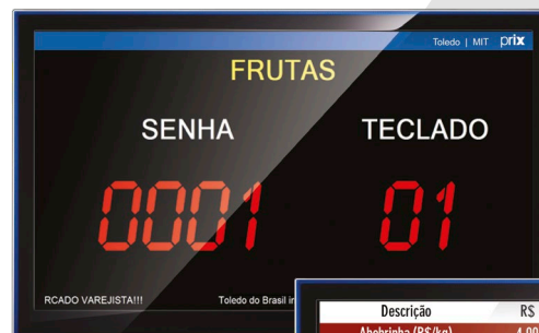
Pop-up de senha

Possibilita anúncios de preços promocionais, fornecedores e propagandas que se alternam com a tabela de preços, oferecendo informação e entretenimento às pessoas que circulam ou esperam naquele local.