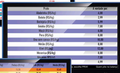
Tabela com 12 linhas