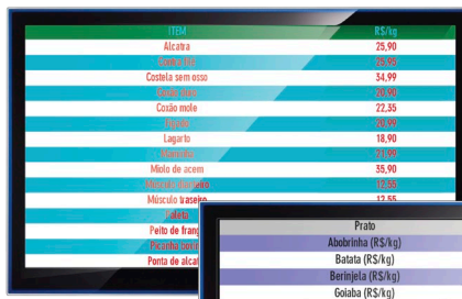
Tabela com 15 linhas

Solução desenhada para eliminar filas e permitir que seu cliente faça as compras enquanto aguarda a chamada de senha de até 3 departamentos diferentes em um mesmo televisor.