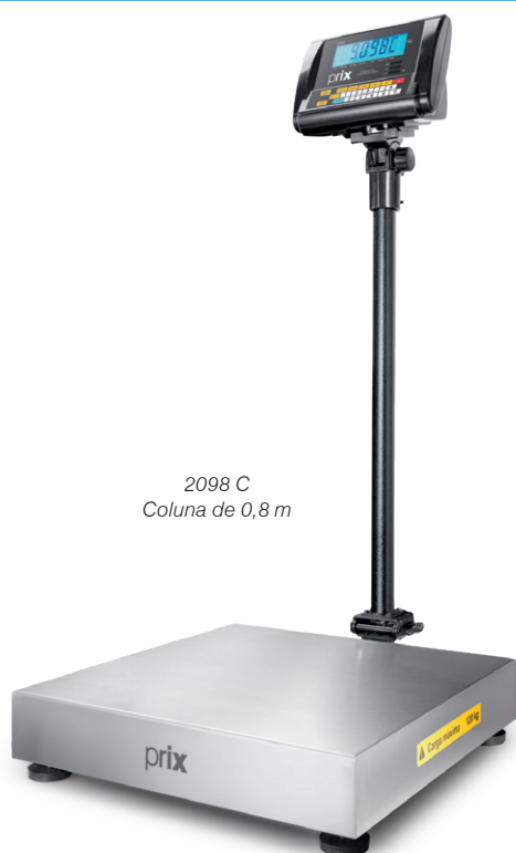
2098 C Coluna de 0,8 m