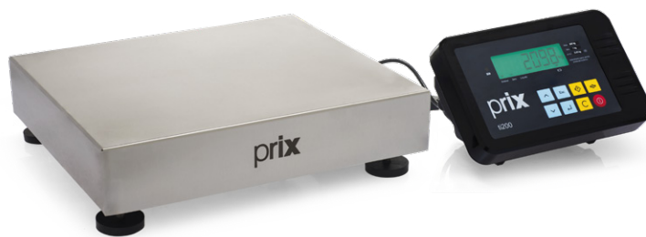
2098 Indicação remota

Possui oito teclas robustas para zerar a indicação de peso, descontar valores de tara, comandar o envio de dados à porta serial, setas de navegação, liga/desliga e "Clear". Constituído de uma unidade selada, minimiza a manutenção e facilita a limpeza dispensando proteções e cuidados adicionais.