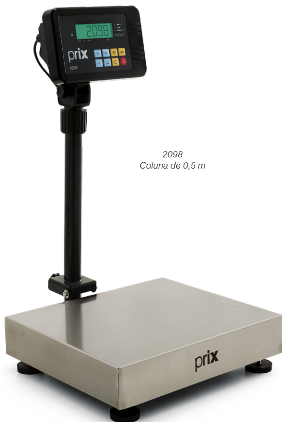
2098 Coluna de 0,5 m