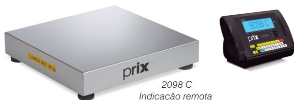
2098 C Indicação remota

Permite realizar contagens por amostragem ou peso médio por peça.