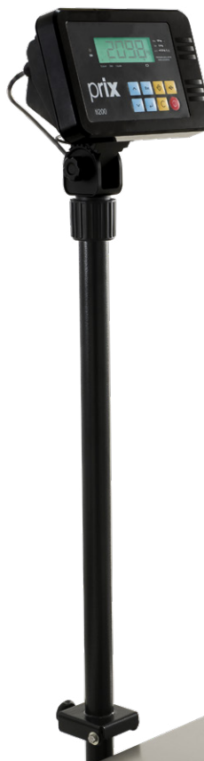
2098 Coluna de 0,8 m

Proporciona quatro níveis de filtro, permitindo adequar a balança às condições do local de instalação que possam interferir no tempo de estabilização da indicação de peso (vibrações ou correntes de ar).