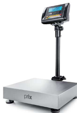
2098 C Coluna de 0,5 m

Possui barramento gráfico auxiliar no display, com setas acima e abaixo, para facilitar o monitoramento das faixas de tolerância dos produtos que estão sendo verificados. Permite configurar as tolerâncias máximas, inferior e superior do peso, determinando a faixa aceitável das pesagens.