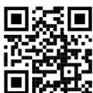
GS1 QR Code