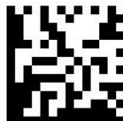
GS1 Data Matrix