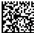
GS1 Digital Link